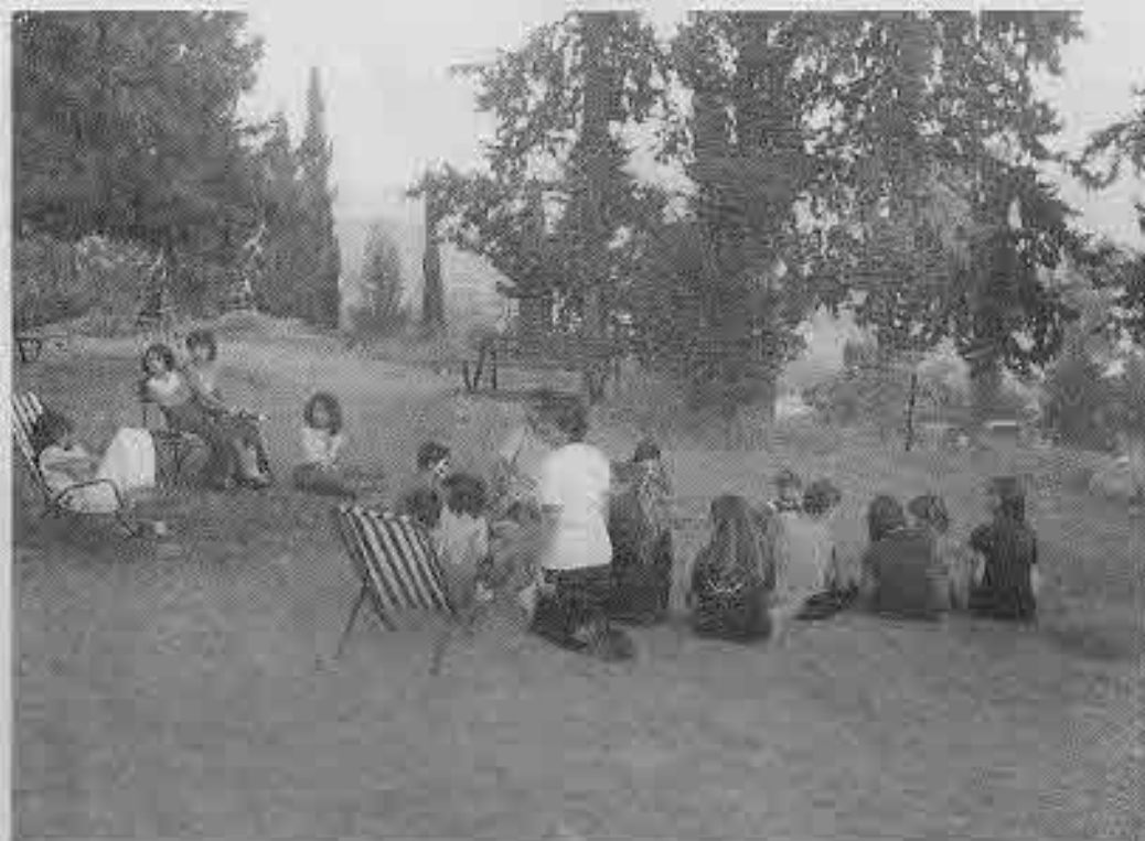
שעת רכוז בקייטנה

כבר 10 שנים אני מדריכה. התחלתי בכיתה ט' יחד עם אבא. הפעילות של הצנחנים היא חלק אינטגרלי מהחיים של המשפחה. אבא הבין מהר שאם ברצונו לעסוק באינטנסיביות זה חייב לכלול את המשפחה. גם אמא מדריכה, גם אחותי, וכיום גם בעלי שהכרתי בצבא. * בהתחלה באתי כי זה היה חשוב לאבא. לא הבנתי מה זה להיות יתום. כיום חשוב לי הקשר האישי עם כל אחד מהילדים. הם חברים שלי. כיום בתור אמא אני כבר לא יכולה בלי זה.