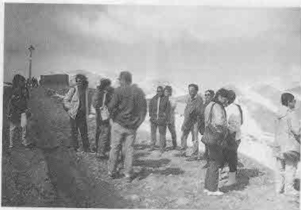
בין שלגי החרמון – ובמדבר