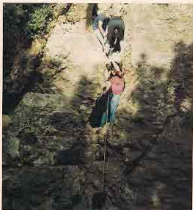
הנולשים לחיק הטבע