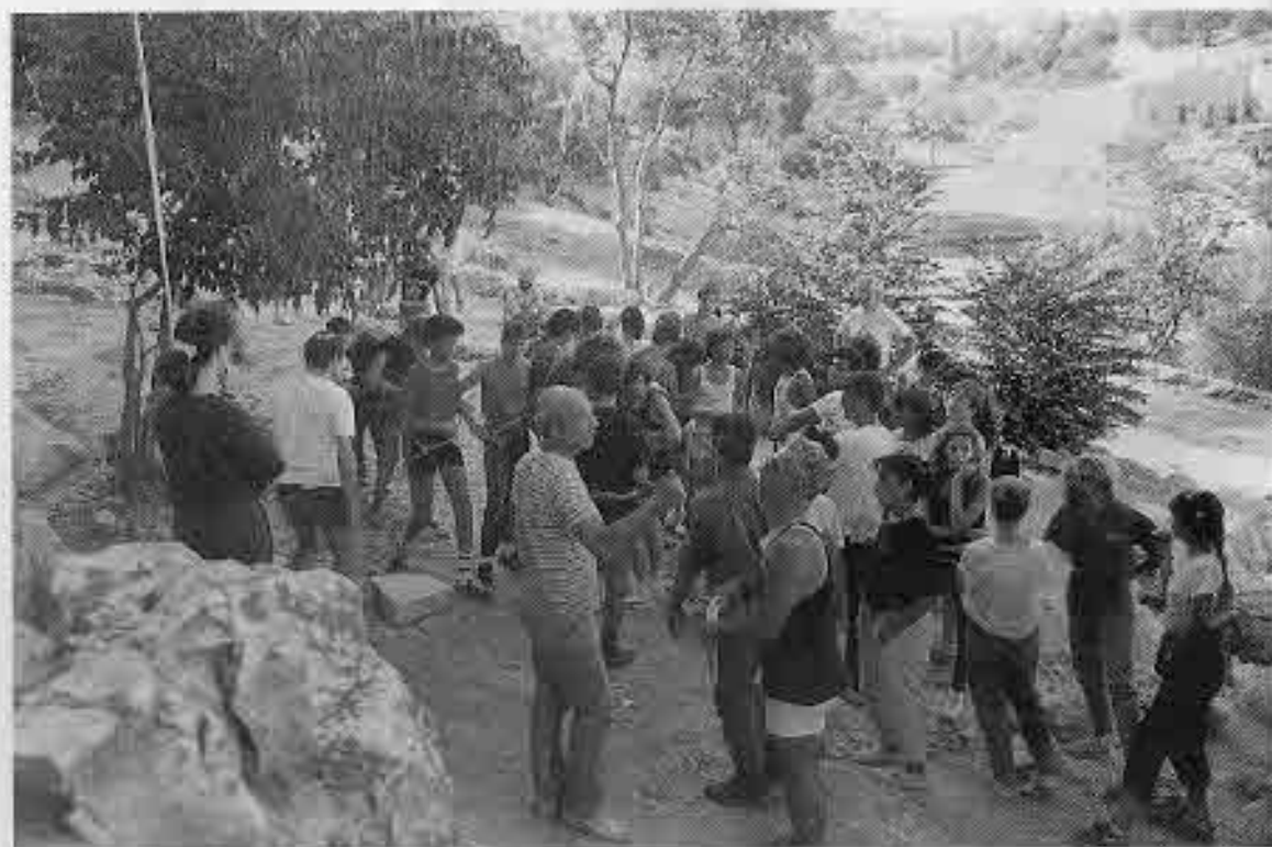
אימוני סנמלינג (גלישה צוקים) בגיא בן הינוס

יש לי בקרן רק משאלה אחת והיא — פחות משפחות לטפל בהם.