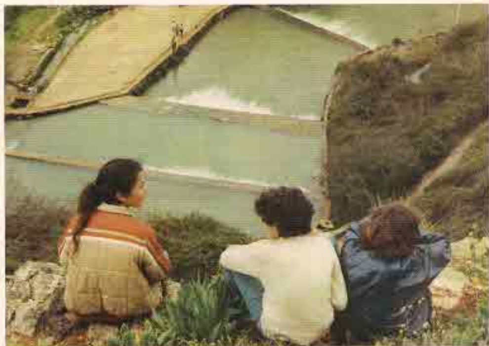
אהבת הארץ בטיולים ובנטיעות