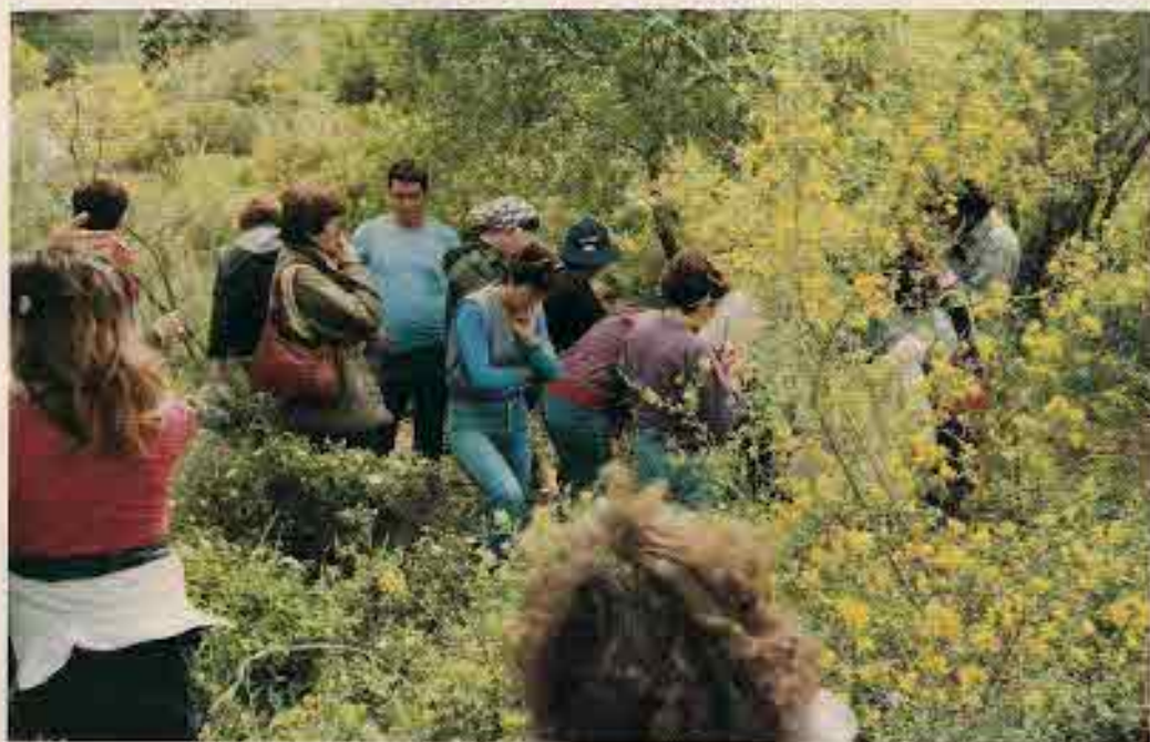
נחוח הארץ ויופיה

אדם בקרן 10 שנים - משתתף קבוע. נערך מהבית בלי סוף מלבד ובנוסף לעבודה. בהתחלה הפריע לי מאוד שבחופשות הוא מבלה עם נשים אחרות. חשתי שזה על חשבוני ואז הצטרפתי לפעילות. הייתי לוקחת חופש מהעבודה והיינו יוצאים יחד. אדם עבד במטבח ואני בחד"א, אולם