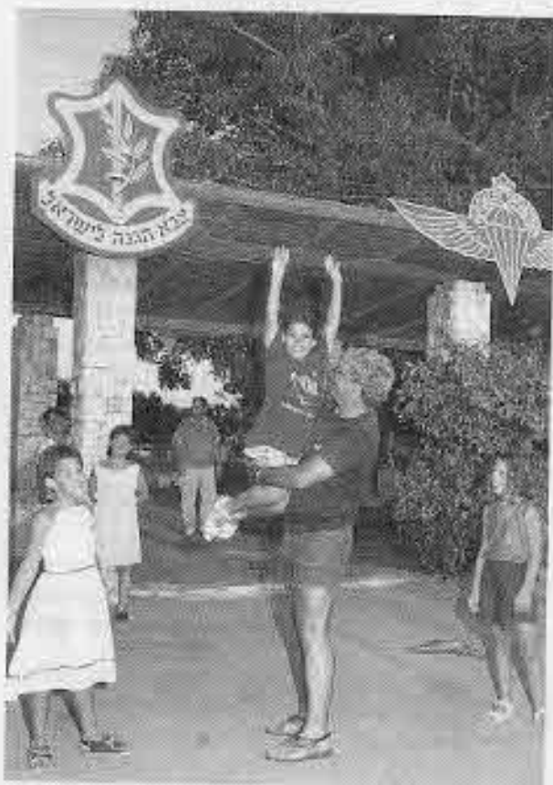
הילדים — במרכז תשומת הלב והאהבה