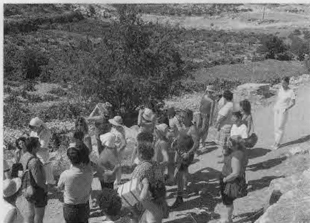
לאורך אמות המים לירושלים

סתי שולח בתדירות גבוהה הודעות אל תוך חלל חדר האוכל. חזרה לחברים,