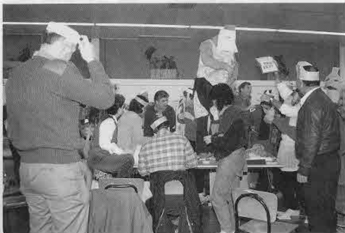
אורחים מצה"ל. באחת ממסיבות הסיום

* אירוע מיוחד: היה לי ילד שחלה בשיתוק והתקשה בהליכה, הוא לא ויתר ורצה לצאת לטיולים. בגיל צעיר לקחתי אותו על הכתפיים וככה טיילנו. בגיל יחד מאוחר הוא השתדל ללכת אבל רוב הזמן הייתי צריך לסחוב אותו על הכתפיים. היום כשאני מסתכל אחורנית קשה לי להאמין באילו מקומות היינו. עלינו וירדנו בכל ארץ ישראל כשהוא על כתפי. אני לא מבין איך עשיתי זאת מבחינה פיזית -