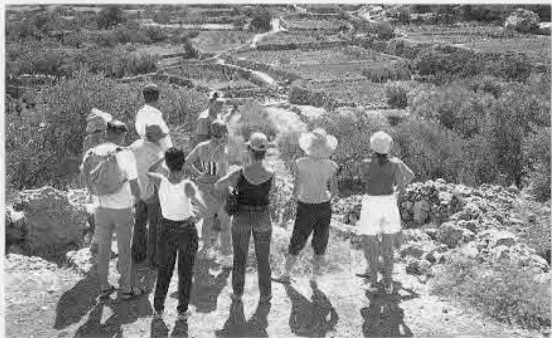
טיולים בירושלים קיץ 84